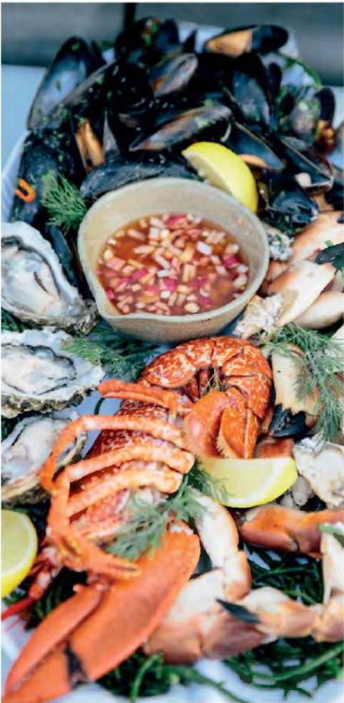
TASTE THE WILD ATLANTIC WAY