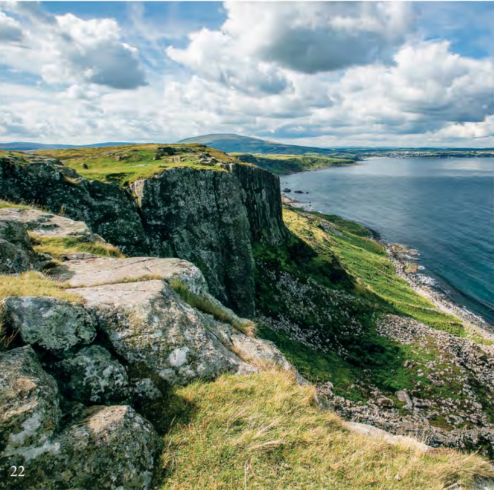
DRAGONSTONE CLIFFS COMTÉ D'ANTRIM

” MANTEAU DE FOURRURE SUR LES ÉPAULES, VOUS POURREZ TESTER VOTRE HABILITÉ AU TIR À L'ARC OU AU LANCER DE HACHE ”