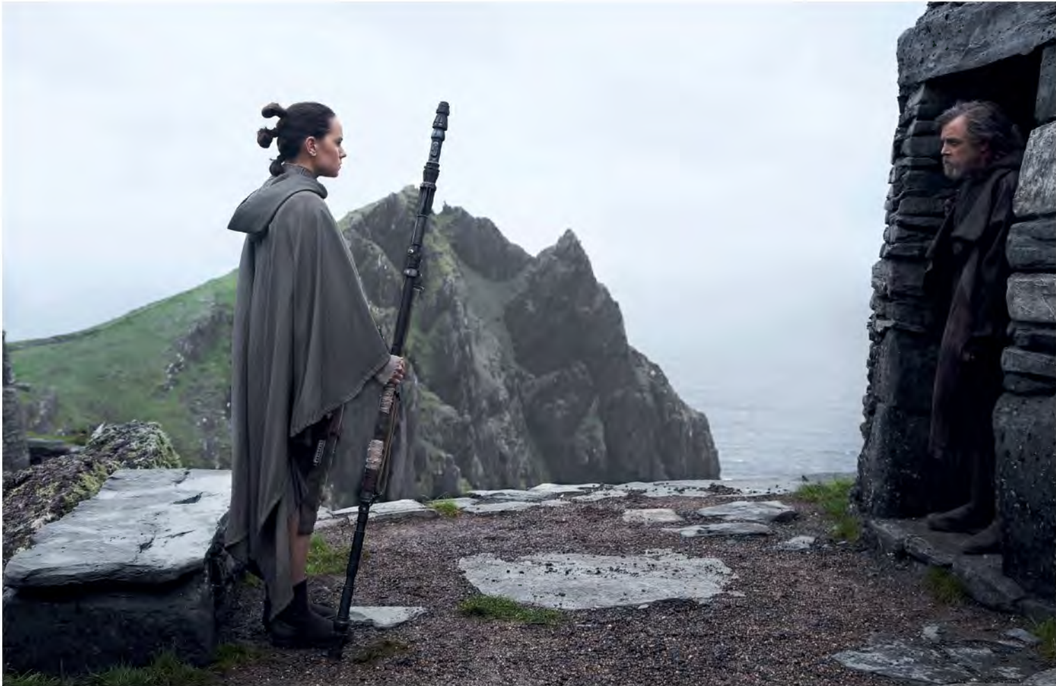
LUKE'S ISLAND WILD ATLANTIC WAY